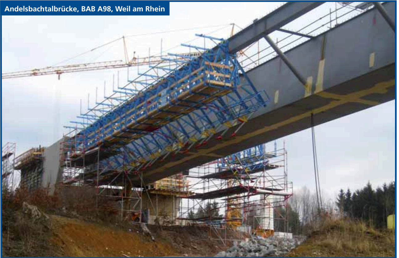
Andelsbachtalbrücke, BAB A98, Weil am Rhein